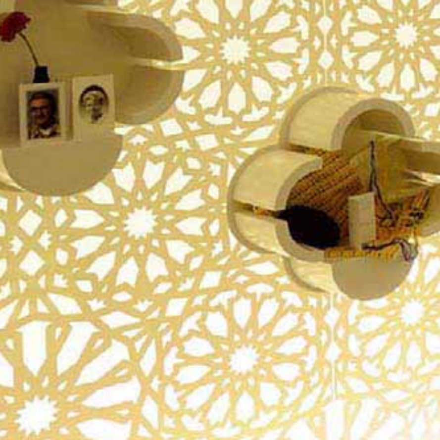
Maaïke Mul, coördinator kunst & cultuur Peppelrode: stilte- ruimte in verzorgingshuis Peppelrode